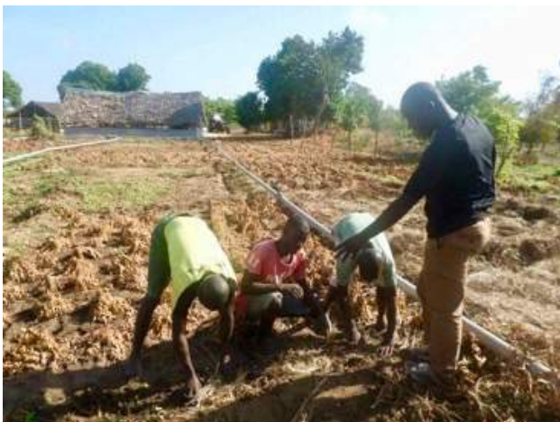
Leren verbouwen zonder gebruik van kunstmest en bestrijdingsmiddelen