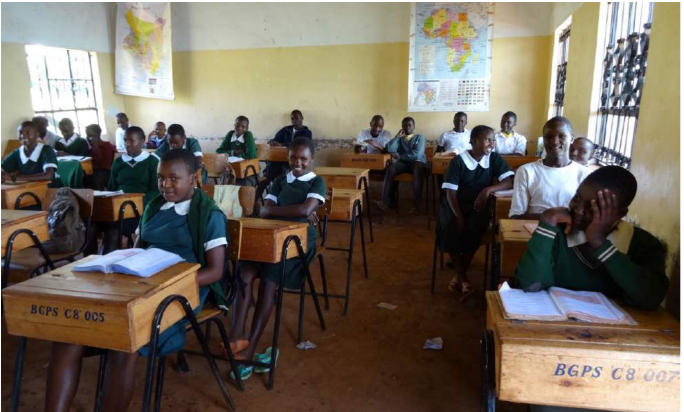
Een lagere schoolklas van BG Nyamira