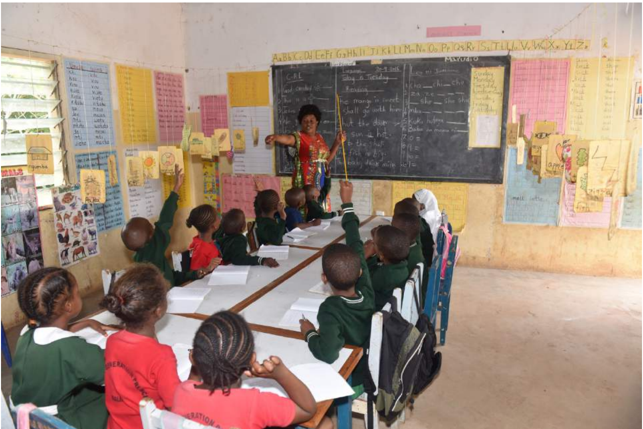
De kleuterklas van BG Malindi

Door verzakking is het schoolgebouw zodanig beschadigd dat nieuwbouw nodig is. Hiervoor zijn in 2016 fondsen gevonden.