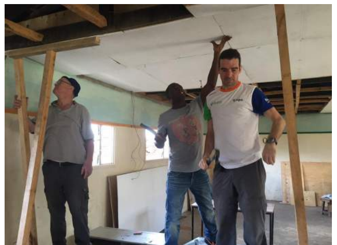
Olympisch kampioen en BG ambassadeur Bob de Jong aan het werk bij BG High tijdens de bouwreis van 2016.