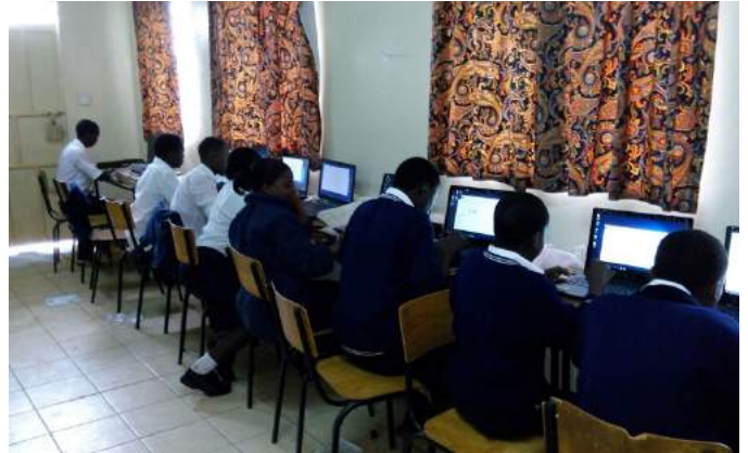
Het schei- en natuurkundelaboratorium en computerlokaal van de BG Highschool